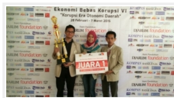
Mahasiswa Akuntansi UGM Juara 1 Paper Competition Ekonomi Bebas Korupsi 2015