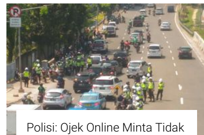
Polisi: Ojek Online Minta Tidak Ditilang Melintas di JLNT Casablanca