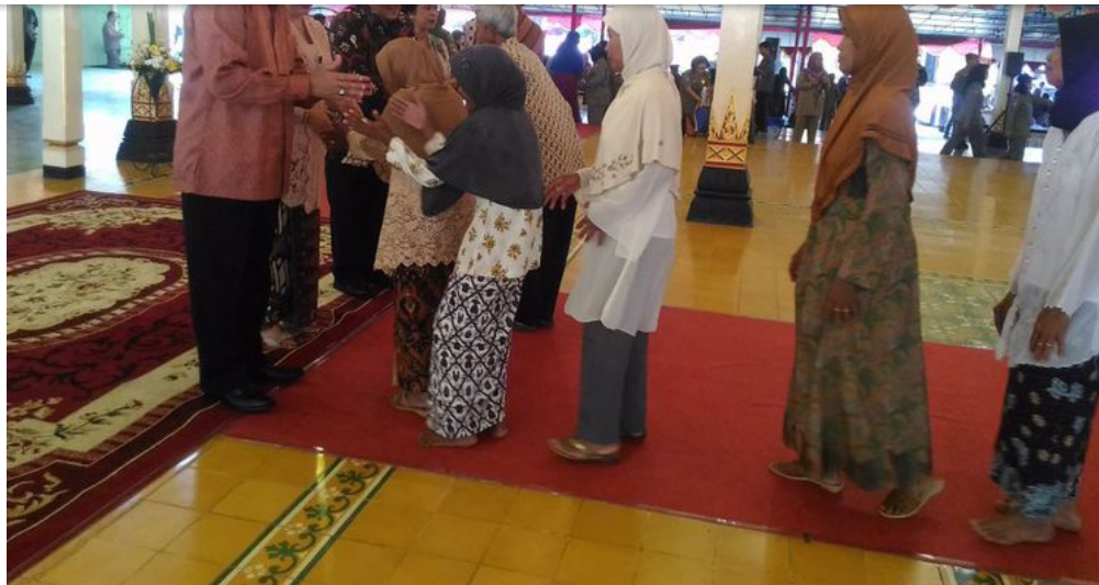
Warga bersalaman dengan Gubernur DIY, Sri Sultan HB X, di bangsal kantor Kepatihan, Jalan Malioboro, Kota Yogyakarta, Senin (3/7/2017)