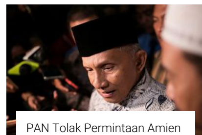
PAN Tolak Permintaan Amien Rais Tarik Menteri dari Kabinet